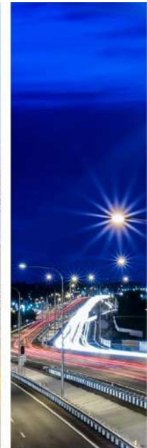
Infraestructura Vial y Férrea