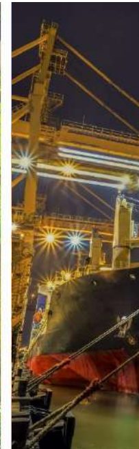
Puertos y Costas