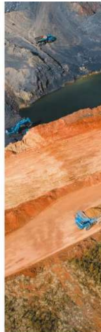
Minería y Energía